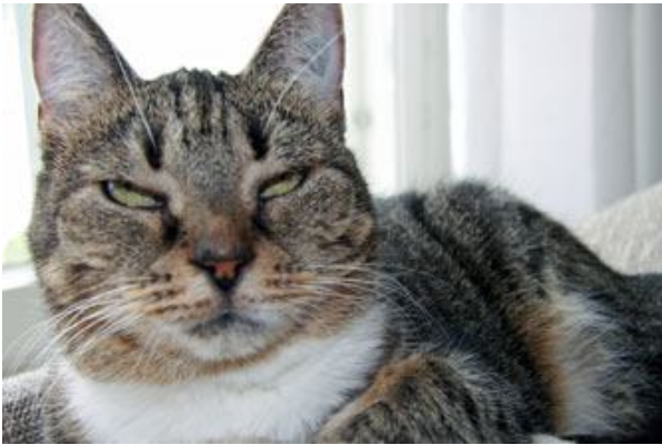
Tässä on Irma. Irma kertoo meille kauneudesta.